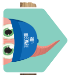
Diese Markierung weist den Weg.

WICHTIG! Bitte sei fair zu anderen Kindern und hinterlasse Rätsel und Kugelbahnen so, wie du sie vorgefunden hast. Beachte: Kugelbahnen sind keine Klettergerüste!